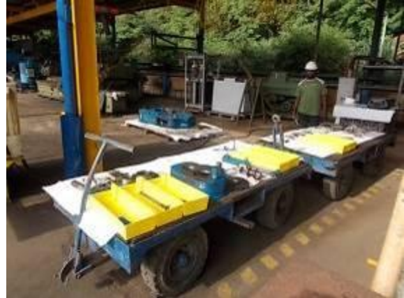
P65) Ordnung und sauberes Zerlegen hilft, dass keine Montage Fehler passieren.