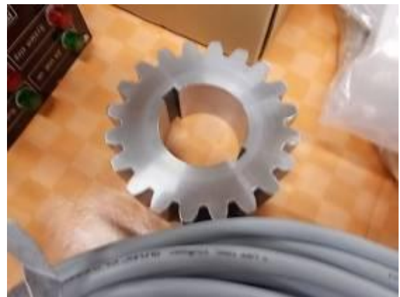
P71) Innerhalb 4 Tagen haben wir ein neues Zahnrad in der Schweiz bekommen. Ein Danke an unsere schnellen und beweglichen Lieferanten.