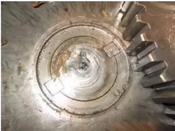
P63) Einige Schadstellen.