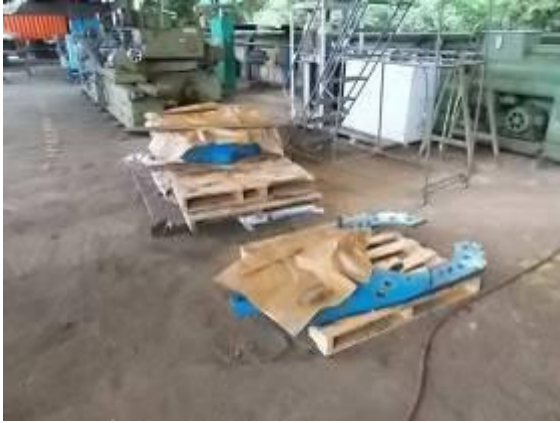
P71b) Bis die Ersatzteile in Angola sind, muss die demonitierte Ware gut geschützt werden. Einölen / fetten und zudecken mit Oelpapier .