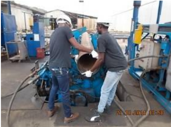
P58) Eine wichtige Maschine, welche Rohrgewinde zusammenschraubt.