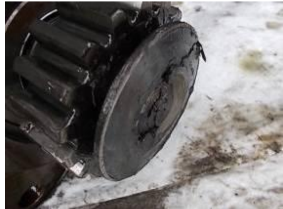
P59) Etwas wanderte im Getriebe.