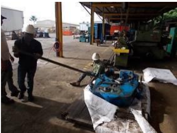
P64) Mit grossen Verlängerungen musste ein Teil der Schrauben geöffnet werden.