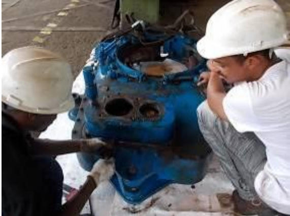
P62) Jetzt wird es geöffnet.