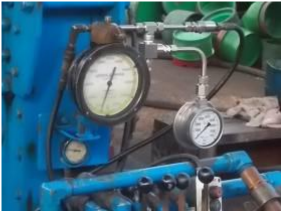
P72) Eine erweiterte Manometer Lösung erleichtert das Arbeiten an der Maschine.