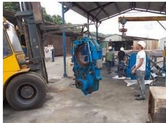
P61) Das Innenelement wird ausgebaut zum zerlegen.