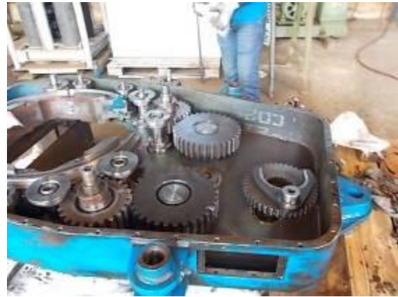
P70a: Gereinigtes Getriebe nach der Ersatzteilaufnahme