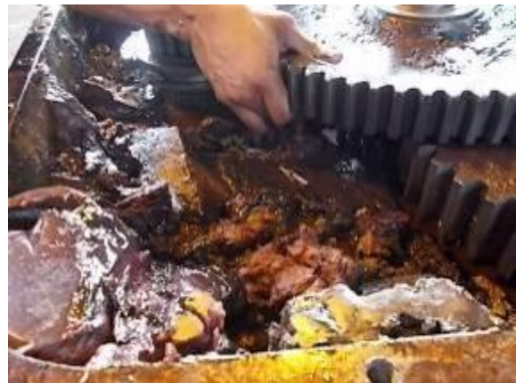
P67) Sehr viel Fett, altes schmutziges Fett. Auch Metallgegenstände enthaltend.