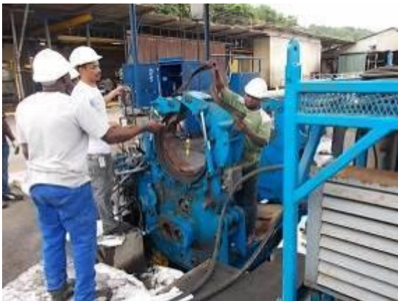
P58b) Wie es ist im Unterhalt, am Samstag, den 29.11.2014, um 16:00, kam die Meldung, dass bei der Farr Maschine das Getriebe blockierte.