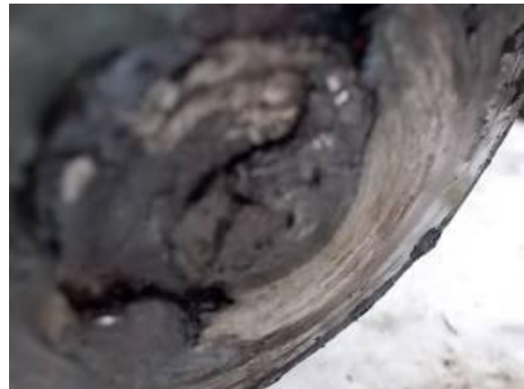
P60) Eine Reibschweissung im Getriebe