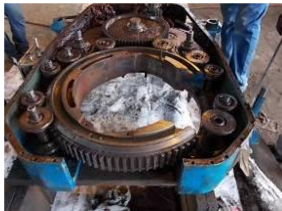
P66) Das Getriebe sieht innen sehr schmutzig aus.