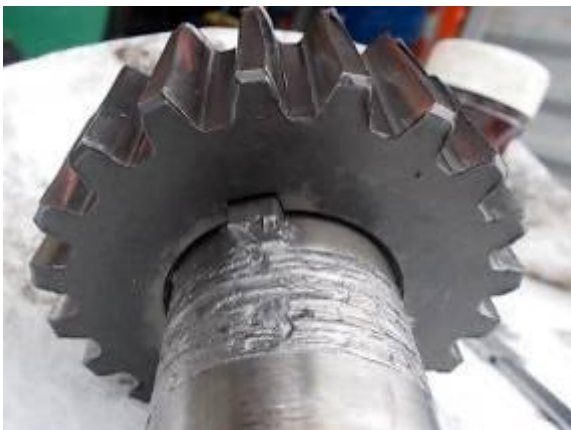
P70) Das grosse Zahnrad: Auf der Welle hat es die Keile abgeschert.