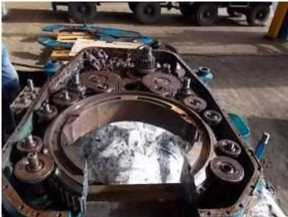
P68) Eine gute Reinigung und Revision schadet hier so oder so nichts.