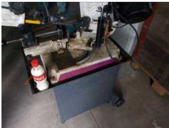
P7: Các ban nhạc nhỏ thấy rằng chúng tôi đã mang đến các container cuối cùng 9 Không. Rất bấn.