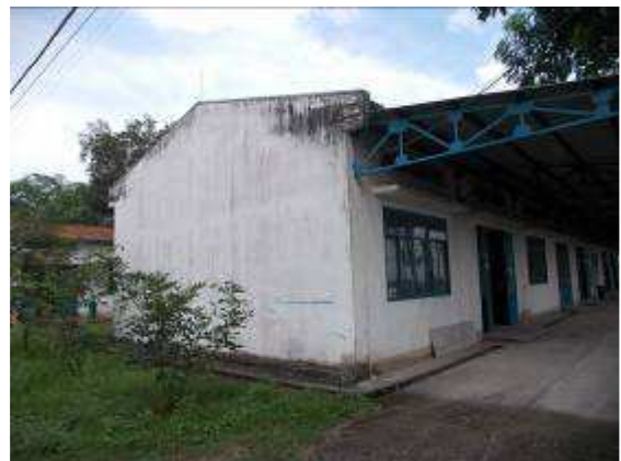
P15: Bức tường này chúng tôi đã 2 x sơn lại kể từ năm 2011. Một lần nữa sau 2 năm nó trông như thể họ chưa bao giờ được sơn 20 năm. Có điều chúng ta cần phải theo dõi.