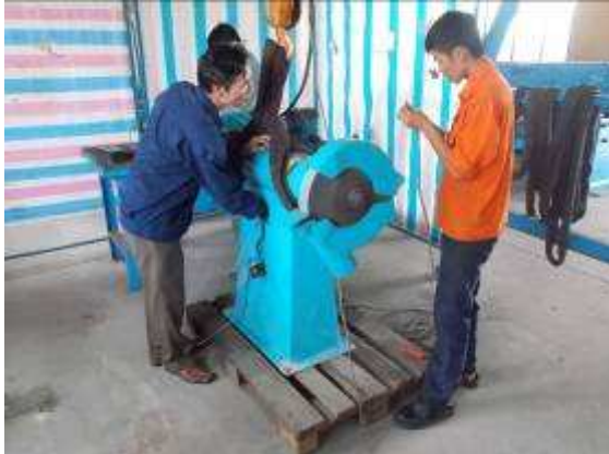
P17: Dưới đây là mài mà chúng tôi nhận được từ các công ty. Flückiger, Gesenkschmiede Obernburg.

đứng đó, đây là những mô hình vai trò của chúng tôi!