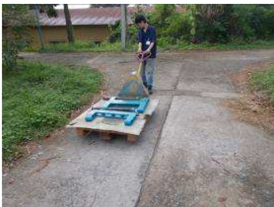
P13: Bây giờ đi kẹp lớn trong kim loại trong phòng 1 để làm tiếp. Re-hàn và trực quan làm cho những cải tiến mà người hướng dẫn là A04 có trách nhiệm.