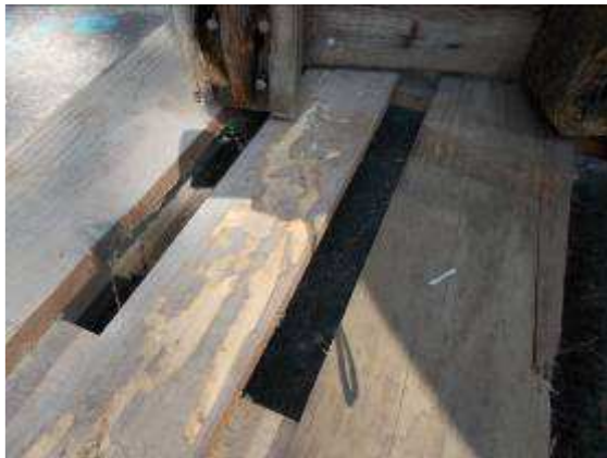
P42: Như bạn có thể thấy điều này "bài hát Term Itten" xấu.