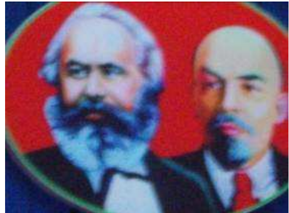
P54: Rear tường khác cũng không phải là hình ảnh của Karl Marx và Lenin. Những người đã đóng một vai trò rất quan trọng về đối tượng của chủ nghĩa tiêu thụ.