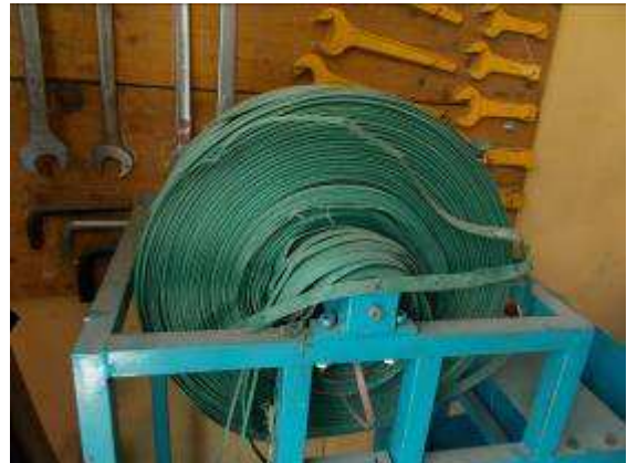
P14: Đây là ban nhạc mà chúng tôi đã mua để ràng buộc. Khi không khí ở Việt Nam họ đang bị phân huỷ bởi không khí không tốt.