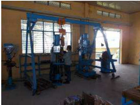
P35: Chúng tôi rất vui mừng rằng chúng tôi thực hiện các cần cầu di động 2 tấn.