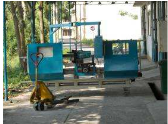
P32: Các từ lâu đã được trái đứng DM2S máy WIAP chúng ta đã chuyển từ 3a không gian trong buồng 5, chúng ta có thể có nhiều hơn tốt.