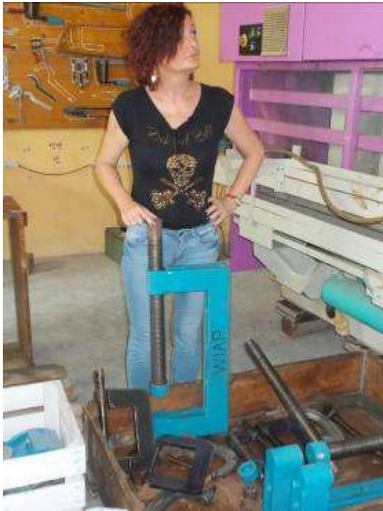
P12: Các kẹp nặng lớn kẹp 400 mm.