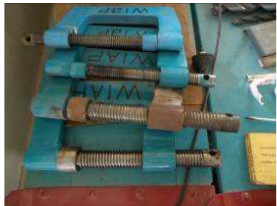
P10: Những kẹp chúng tôi muốn trong thư gửi đến Thụy Sĩ. Nhưng nhà nước không phải là ở tất cả tốt đẹp. Nếu vậy đã đến ở Thụy Sĩ sẽ là sẽ là một trong những disgraces lớn nhất được cho hệ thống trường học của chúng tôi.