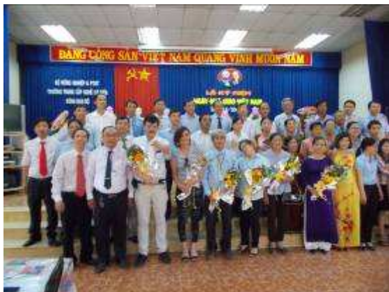
P53: Bây giờ thậm chí đã có một bức ảnh nhóm của toàn trường bởi tất cả giáo viên.