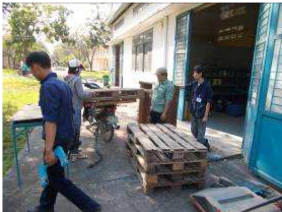
P43: Chúng tôi phải vứt bỏ hỏi những pallet vào không khí cởi mở. Chúng được vứt lên trong phút và cảnh báo biến mất. Chúng tôi muốn ghi nhưng đã không làm như vậy. Min 20 pallet và 15 bãi, chúng tôi đã bỏ đi.