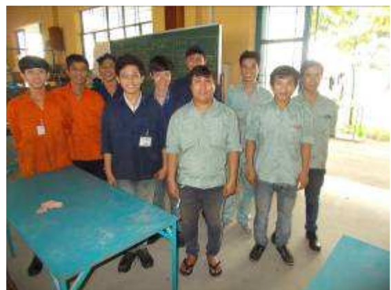
P16: Học nghề của chúng tôi với các giáo viên hướng dẫn. Quá xấu mà giảng viên chính như là một mô hình trên tất cả các hình ảnh mặc dép mở