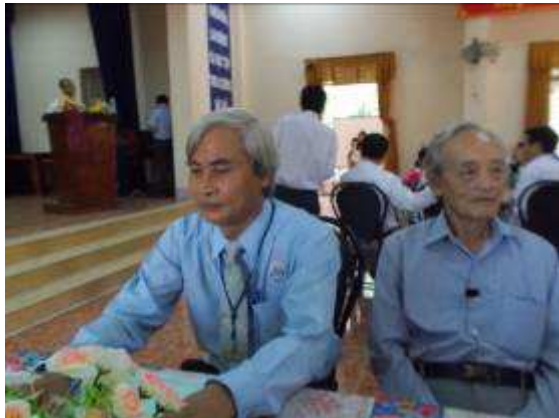
P52: Vào sáng thứ Sáu vẫn là ngày các giáo viên tuyệt vời tại Việt Nam trong 20 tháng Mười Một. Ở đây lại hiệu trưởng Bang và bên cạnh ông Giám đốc về hưu cũ.