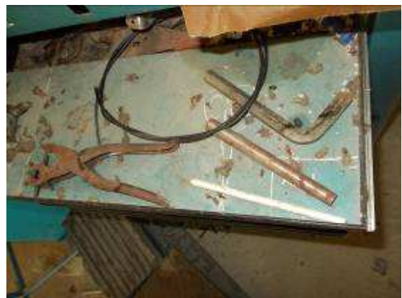
P40: Hầu như không có công cụ ở trong đó, Geko "rác rưởi" và những gì khác có được rỉ sét.