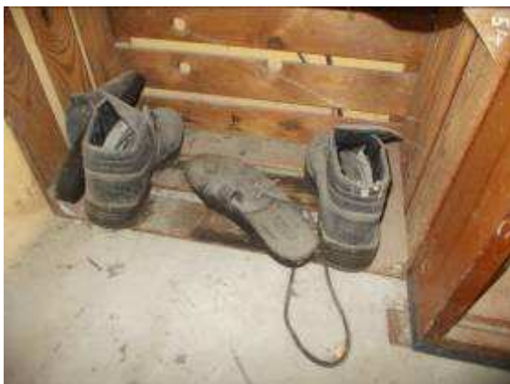
P37: Vẫn là giày phía sau bàn của tôi. Thật không may, có lẽ lâu không còn làm sạch.