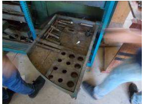
P9: Trong phòng 2 các xưởng cơ khí, tất cả các ngăn kéo ở bên trong rất bấn và lộn xộn.