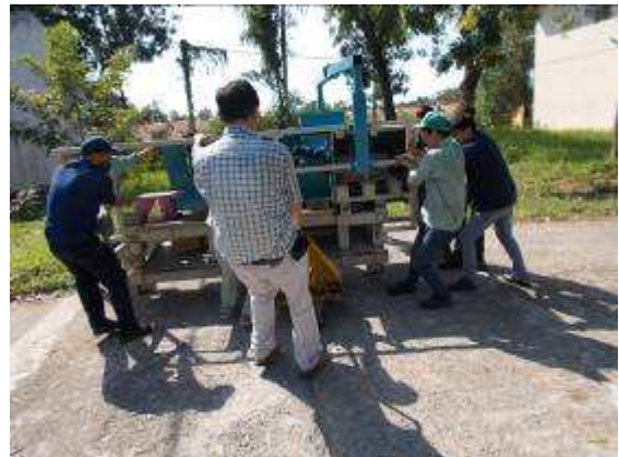
P33: Với xe tải pallet trên sàn xi măng rất nghèo vì lỗ rất nhiều, các phương tiện giao thông là khá khó khăn. Nhưng chúng tôi quản lý.