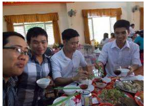
P56: Sau buổi lễ, vẫn đến để thưởng thức bữa ăn cùng với tất cả các giảng viên của chúng tôi và quản lý trường học.