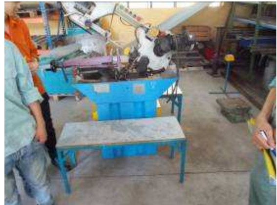
P45: Trong 4a phòng chúng tôi có phòng cắt. Trên tất cả các máy chúng tôi thực hiện các hộp màu vàng. Đó cửa này là 2 hộp màu vàng có, cho thấy nơi núi thứ hai là quá lười biếng để đi bộ tới máy và không thấy rằng ngay cả một hộp màu vàng được gắn kết. Các tài liệu trong hộp màu vàng không được điền rõ ràng bây giờ chúng tôi đã thử nghiệm với thanh tra.