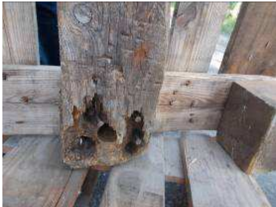
P41: Pallet là nhiều tham lam xuống từ sâu bộ.