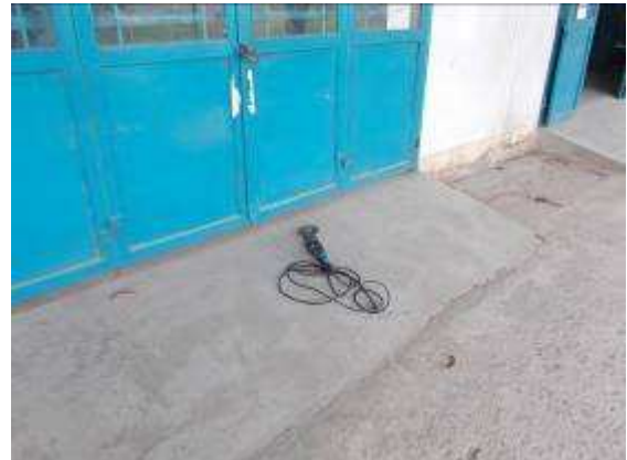
P20: Tách biệt 1b Mục tiêu của lâu đài. Đối với một số lý do, chìa khóa đã biến mất.