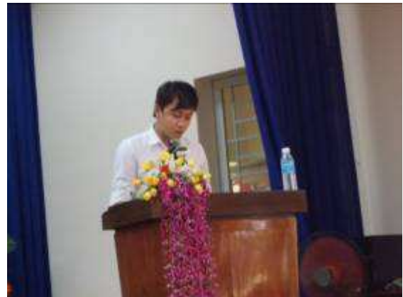
P55: Học nghề của chúng tôi từ nhóm D là phát ngôn viên của nhóm được lựa chọn của dự án WIAP của chúng tôi.