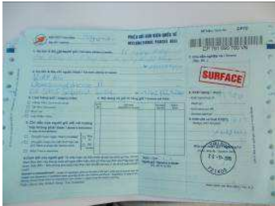
P51: 3 chứng từ vận tải như vậy có.