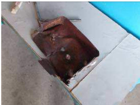
P24: Và rỉ sét. Nhiệt cũng đã được thay đổi vị trí đá.