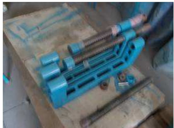
P11: Những kẹp lớn có kiểm tra trực quan cũng thất bại. Trục không gỉ đầu! Deburring đủ.