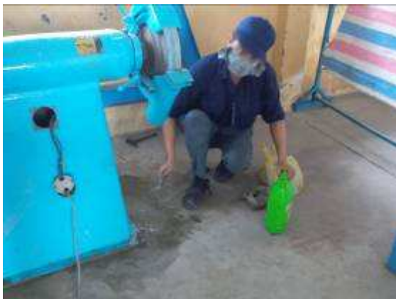
P18: Máy được gắn vào phía dưới.