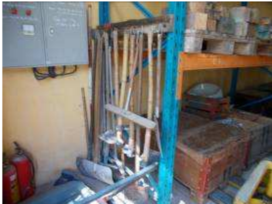
P36: 3a Trong phòng chúng tôi cũng có công cụ của chúng tôi cuối cùng tốt đẹp đó là tất cả mọi thứ được treo trong một hộp lưới.