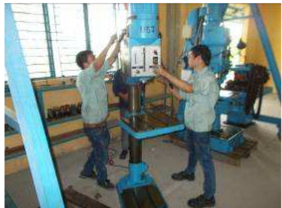
P34: Còn tất cả các cuộc tập trận đã được gỡ bỏ từ các pallet gỗ, kể từ khi chúng tôi đã tìm thấy rất nhiều lỗi trong pallet gỗ.