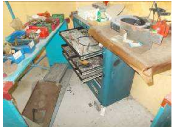
P39: Dám đứng trong phòng lắp ráp nhìn khủng khiếp. Bởi vì có rất nhiều Gekos có "Schitt" đồ nó trông thật thảm hại. Chúng tôi tự hỏi những gì đã được học nghề và giáo viên hướng dẫn của chúng tôi trong những tháng gần đây đã khiến.