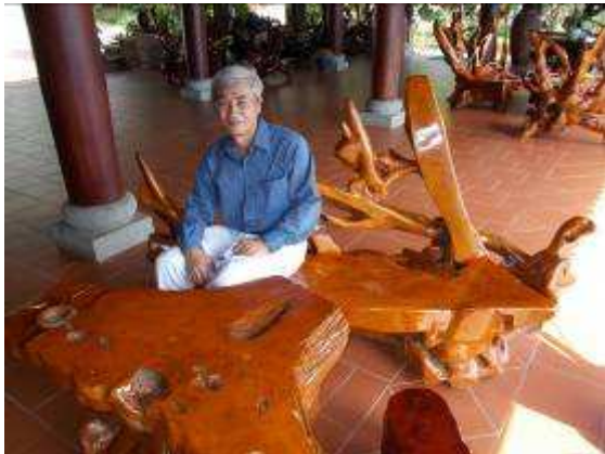
P29: Ghế Buồn cười ở bàn tiếp tân của khách sạn Chez Carole mà là hoạt động ngoài trời với chỉ một mái nhà.