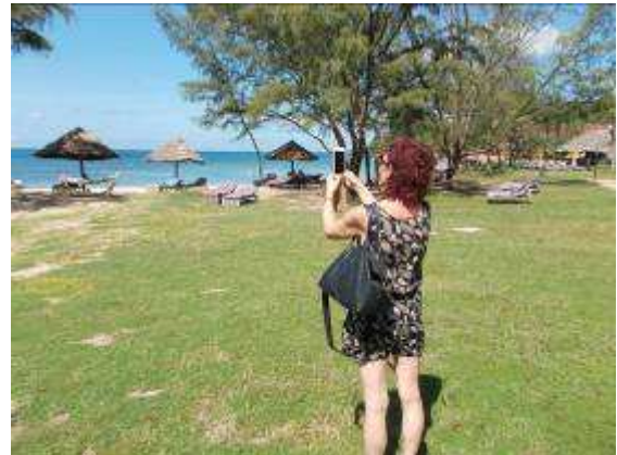
P26: Một tour du lịch nhỏ vào ngày thứ Bảy đã cho chúng ta những ấn tượng hơn của hòn đảo.