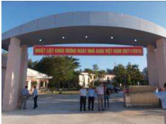
P30: Vào sáng thứ hai vẫn còn mở cửa của trường. Chúng tôi là những người đầu tiên kể từ khi cho phép thông qua.