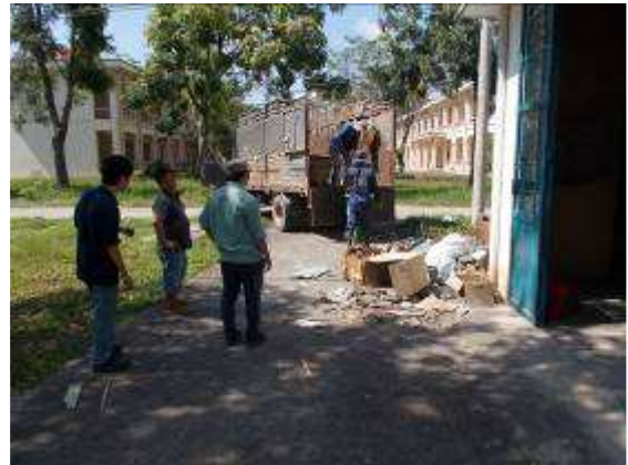
P44: Đối với các mặt hàng còn lại cũng là một chiếc xe tải và lấy nó ra. Ở Việt Nam đó là miễn phí.