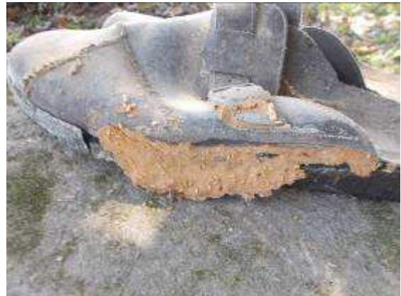
P38: Ngàn sâu bọ có ở những đôi giày, chúng tôi đã vứt bỏ tất cả mọi thứ. Ngoài ra, tất cả các hộp gỗ thanh lý khoản của.