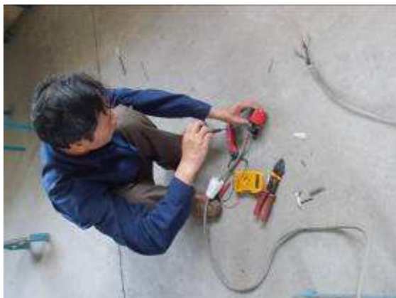
P19: Giáo viên thợ điện chúng ta gia nhập.