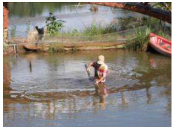
P27: Trước cửa sổ khách sạn của chúng tôi là một người làm việc trong nước.