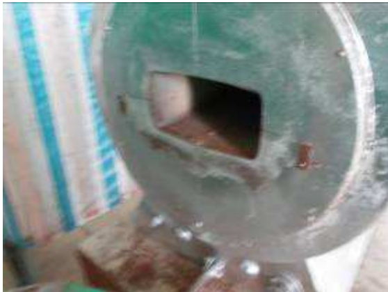
P23: Các lò làm cứng chút trong việc sửa chữa, cánh cửa đã bị phá vỡ.