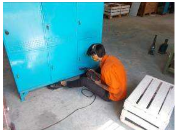
P21: Các tủ mới tủ quần áo, nơi tất cả người học nghề có thể cung cấp giày. Hướng dẫn giảng dạy dứt và có thể di chuyển trong giảng dạy. Nội các đã học nghề.