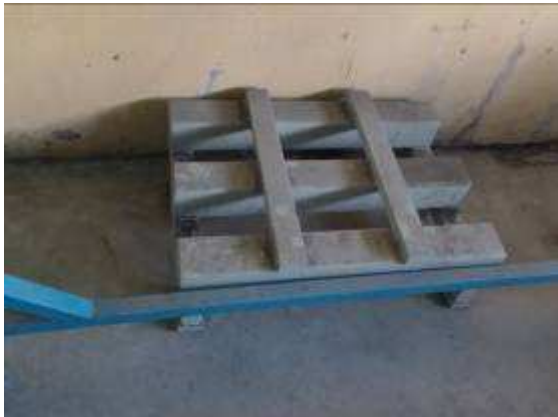
P6: Các khung hình cho máy tiện CNC WIAP DM2 S là bấn vào một góc!