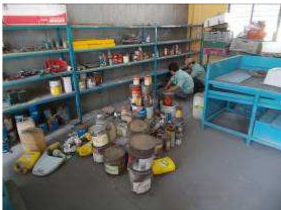
P8: Trong bức tranh, chắc chắn là hơn 100 lon màu không có màu sắc! Tại sao không xử lý?