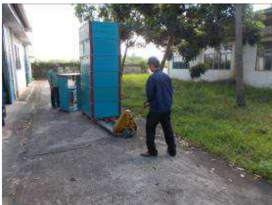
P31: Trong hệ thống trường học của chúng tôi, chúng tôi có 2 tuần chủ yếu là chỉ tất cả mọi thứ chúng ta tổ chức lại một cái gì đó mà người học nghề có niềm vui hơn.