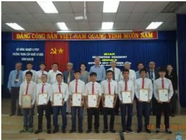
Foto 9: Gruppenbild mit Generalkonsul und seiner Gattin. Bei der Zeremonie

Feierlichkeiten teilgenommen. Hier hält er seine Ansprache.