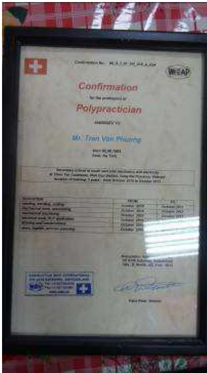
Bild 4: Certificat für die erste Gruppe. Dieses wurde genehmigt aus Hanoi so auszustellen