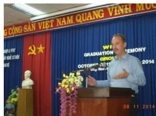
Foto 8: Der Schweizer Generalkonsul Herr Othmar Hardeger, hat an den