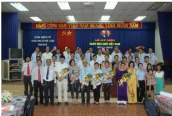
Bild 5. Abschluss Ceremonie der A Gruppe Start 2010 Ende 2013. in dem Schulareal der Schule des Agraministeriums in Vietnam Nähe Saigon.