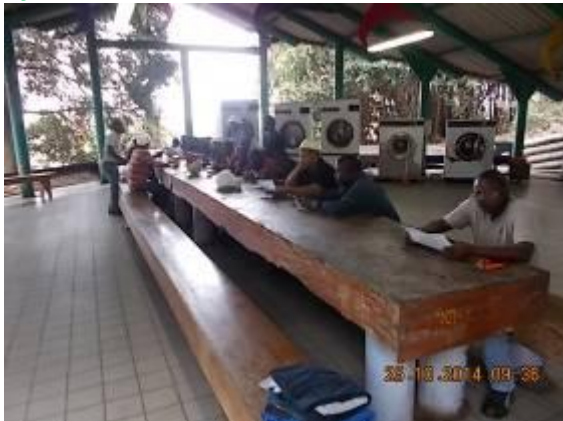
Bild 1: Leute / Facharbeiter in der Schulung bei WIAP in erster Linie Erwachsenen Schulung