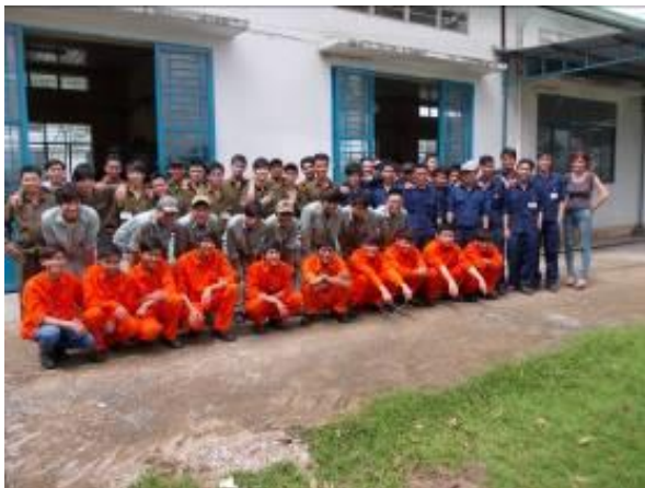
Bild 4: A Gruppe blau, B Gruppe braun, C Gruppe grün, D Gruppe Orange 12 neue Lehrlinge der D Gruppe .