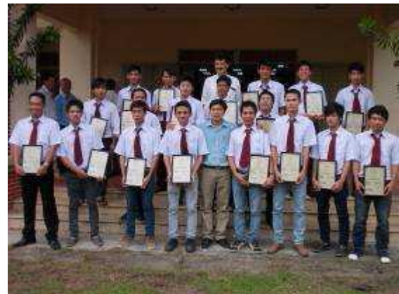
Bild 3: 1. Gruppe Lehrlingen in Vietnam 20 Die Polypraktiker lernten nach dem Dualbildungssystem WIAP