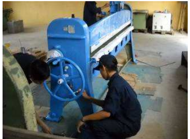
P21: Geduldig musste jede Ecke ausgestrichen werden nach einer exakten Reinigung und viel Abdeckarbeiten.