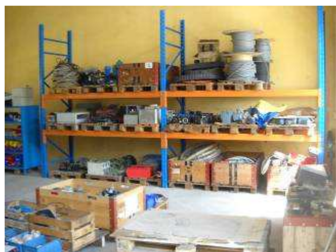
P27: Hier noch Viele Kabel, Motoren mit Getrieben u.s.w