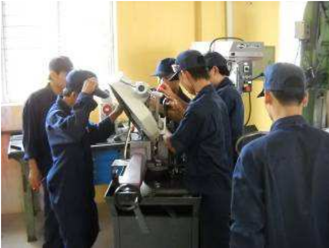
P1: Endlich nach dem Sturz beim Umzug der Säge, wo einige Teile gebrochen waren, geht sie wieder.

Projekt Wiap-KFKOK Vietnam, Install, Setting up The 2. school of south east area mechanics and electricity at Thien Tan Commune, Vinh Cuu District, Dong Nai Province; Vietnam erstellt: Samstag 25.12.2010