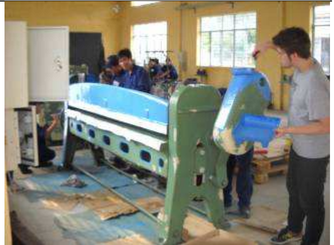
P20: Dann Start der Malerarbeiten die ersten Maschinen.