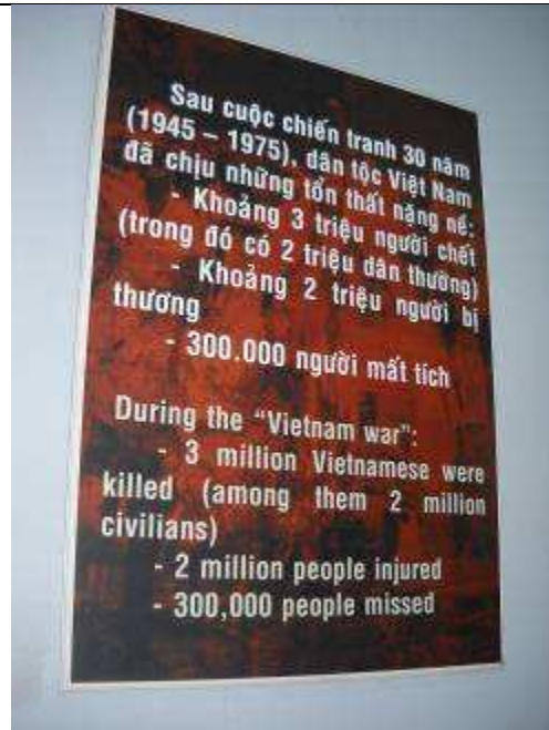
P30: 3 Millionen Vietnam Leute getötet, davon 2 Millionen Zivilisten. 2 Millionen Verletzte 300 000 Vermisste, das war der Krieg Vietnam. War das nötig?