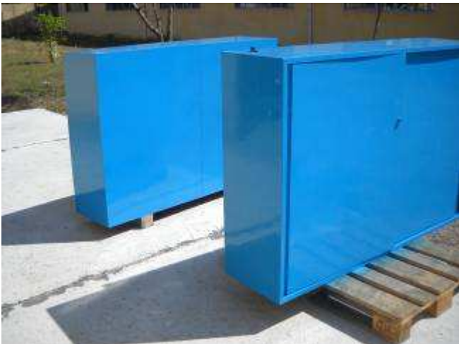
P19: 1 Tag danach, kommt die Ware aus der Spritzerei.