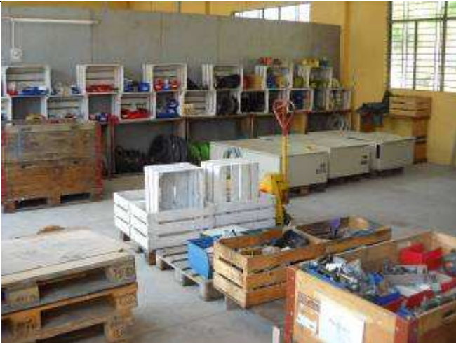
P28: Bald ist die Elektrowerkstatt fertig, So richtig Feinaufräumen machen wir später, denn wir werden sicher immer wieder froh sein wenn wir einer Gruppe Lehrlinge in einem der 7 Räume was zu tun haben.