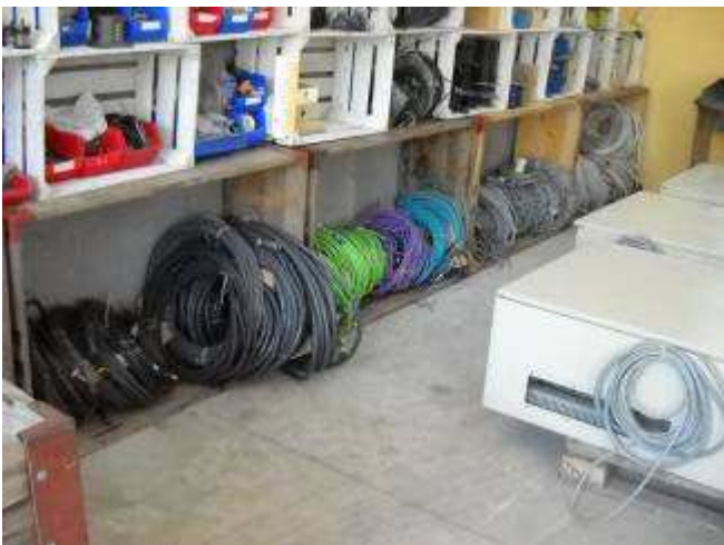
P29: Viele hundert Meter Kabel haben wir dabei, auch da wird dann noch alles nach Adernzahl und Querschnitt sortiert, aber später.