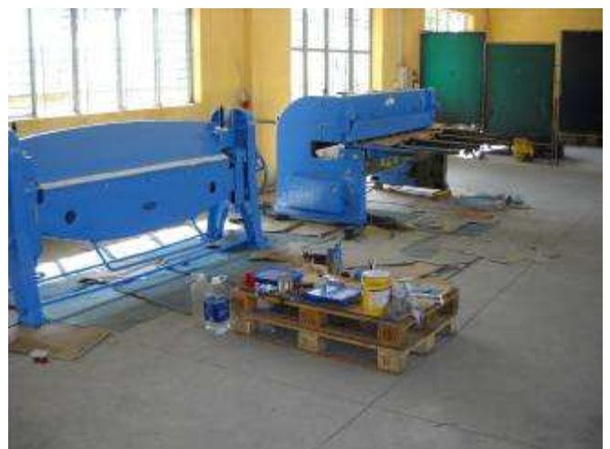
P22: Langsam sehen die alten Maschinen richtig bunt aus. Iris meinte zwar es sei jetzt alles blau!