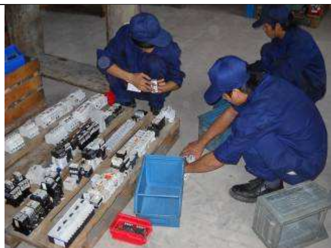
P25: Die Einräumarbeiten in der Elektrowerkstatt sind ein guter Start für die Lehrlinge. Kein Lehrer wusste was das ist was da so rumliegt!