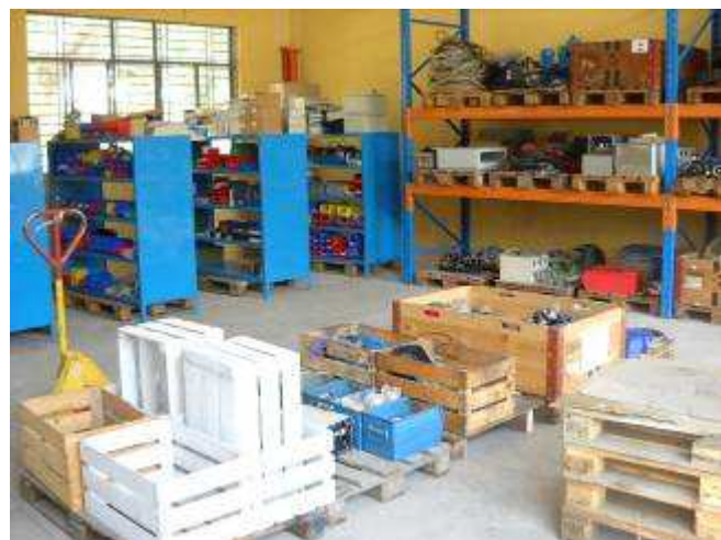
P26: Die Gestelle sind voll, viel Ware wo man auch gut zeigen kann, was für was ist.