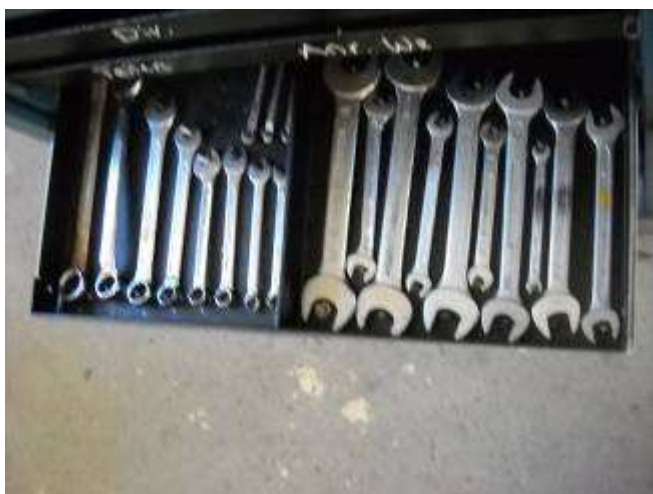
P24: Schön eingeordnetes Werkzeug, es gibt noch min. 3 Tage Arbeit, aber wir wollen alles was fehlt sofort erkennen.