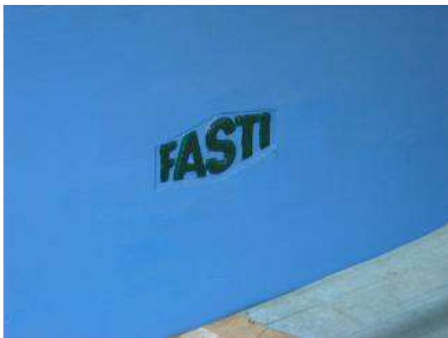
P23: Die Biege Maschine Fasti kann bis 2 mm x 2m