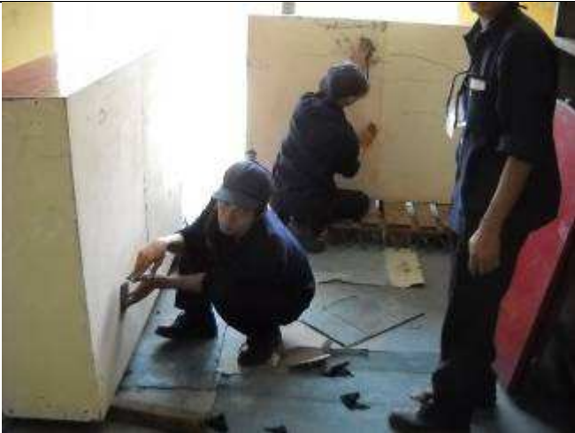
P18: Die Büroschränke standen lange im Lager. Und Stahlschränke aus Europa in Vietnam rosten. Also reinigen und schleifen.