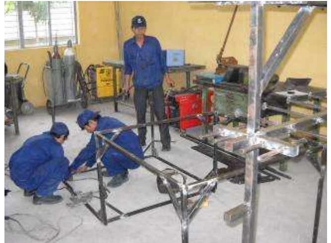
P14: Room 1A, Schweisserei alle Maschinen aus der Schweiz. Jetzt dürfen die Lehrlinge arbeiten. Bald machen wir auch noch ein Schweisstisch bereit.