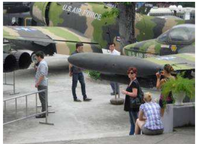
P31: Ja diese Geräte töteten Millionen Menschen

Gestützt auf den Sachverhalt, dass wir den Verein KFKOK, Kinder für Kinder ohne Krieg den wir selber gegründet haben, diesen auch stark finanziell unterstützen, erlauben wir uns, auch dieses Thema noch beizufügen mit dem grossen Wunsch, dass so was nie mehr passiert. Wir werden jedenfalls alles was in unser Möglichkeit steht dafür einsetzen. Auch dieses Bildungsprojekt ist ein Teil des Weges, für kein Krieg.