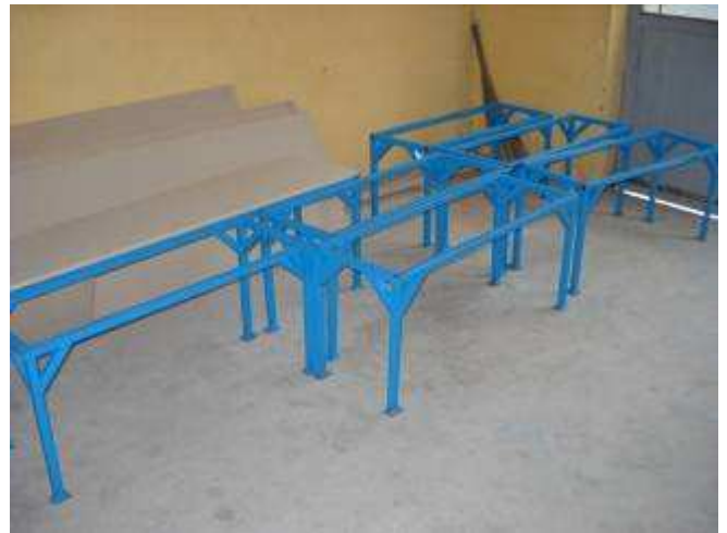
P15: das sind Sitz Bänke die wir für die Lehrlinge machen im Bildungsraum.