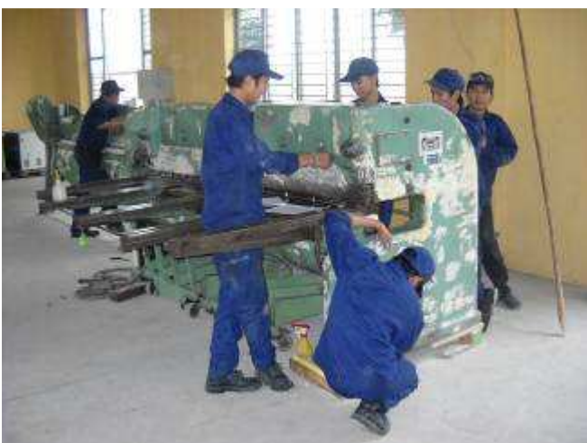
P19a: Vorbereiten der Blechmaschinen. Die spritzen wir nicht, weil wir noch kein 2,5 Tonnen Stapler haben, nur 1 Tonne um sie in die Spritzerei rüber fahren zu können.