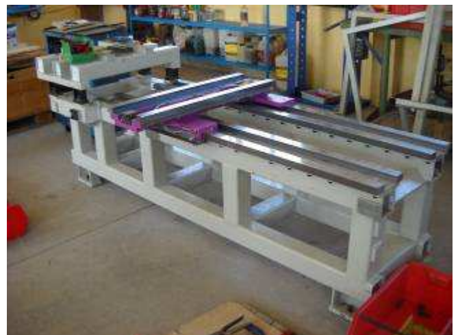
P4: Hier ist die neue Dm2 S CNC Flachbett Drehmaschine. Die Nr. 1 hoffen wir man kann bald weiter machen und die Jungen dabei schulen.