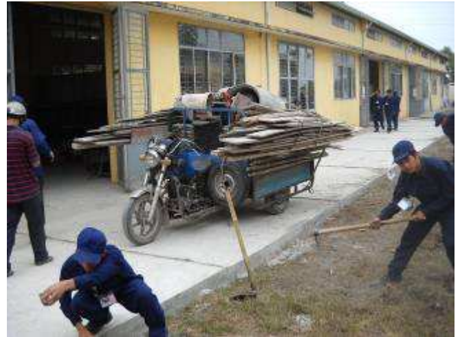
P2: Hier der Transporter, man ist fertig, Das Baugeschäft das unser Innendach neu gemacht hat und die Strasse. Bis 1,5 Tonnen kann man auf so ein Fahrzeug laden!