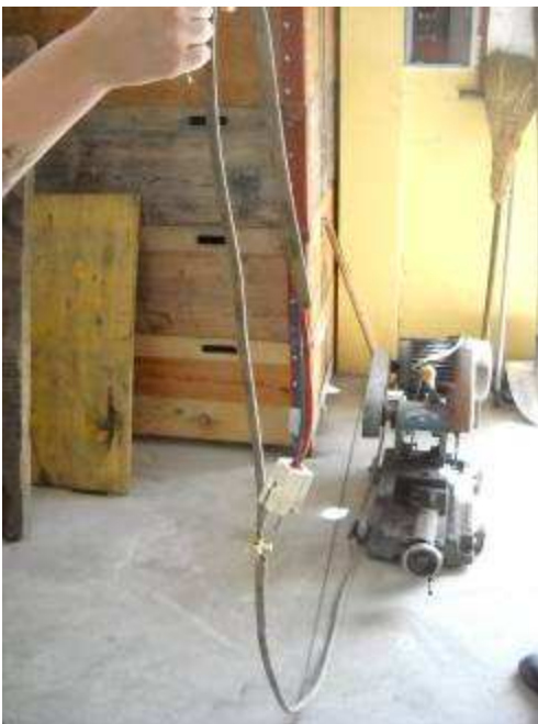
P1a Die Ersatz Säge die wir bekamen hatte ein El.Kabel das minimum 5 teilig war überall zusammengeklebt. Diese Lehrer, müssen noch einiges lernen