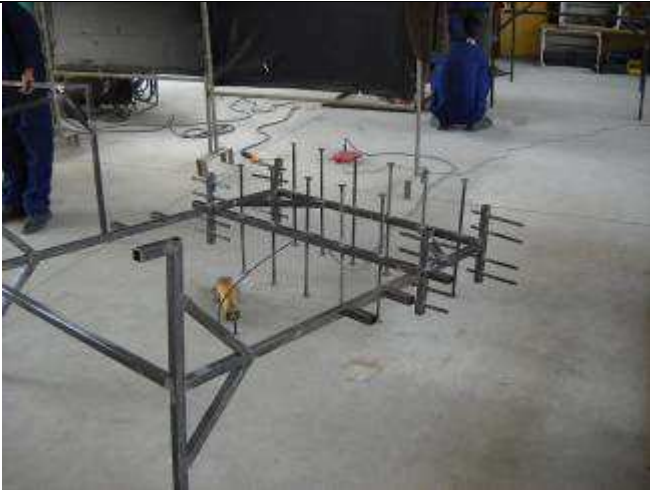
P09: Hier der Seilwagen in der Schweisserei