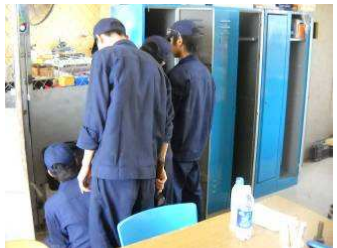
P17: Hier hat man noch die Garderoben Schränke neu gespritzt und jetzt macht man noch Tablare rein.