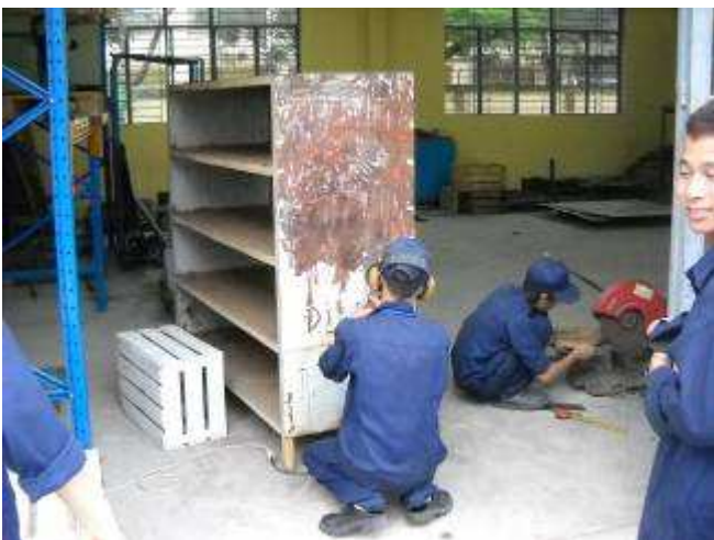
P12: Noch den Schrank Nr. 5 für die Elektro Werkstatt den wir herrichten, dann ist unser Elektrowerkstatt ok.