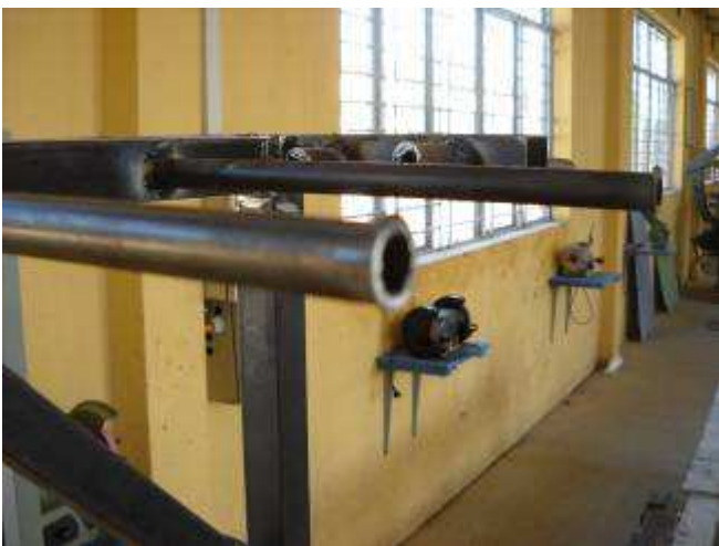
P11: Unser Seilwagen. Er war so schlecht entgratet, dass wir wieder die Schweisserei bemängeln mussten, da haben wir noch einige Arbeit vor uns bis der Lehrer weiss was wir meinen.