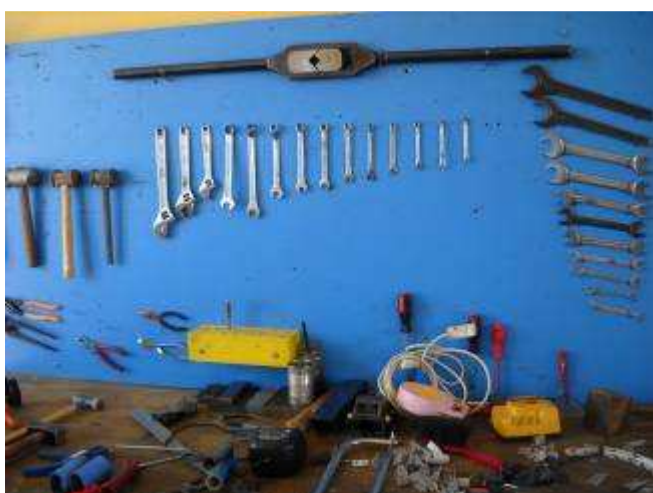
P24a Auch mehrere Werkzeugwände werden hergerichtet. Alles markiert alles mit Farbe versehen, dass man sofort merkt, wenn etwas fehlt